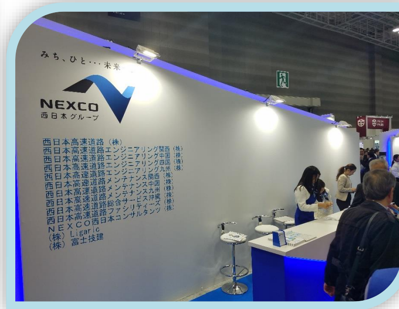
NEXCO西日本ブース(受付)