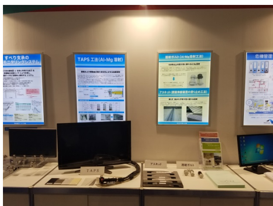
富士技建 展示状況