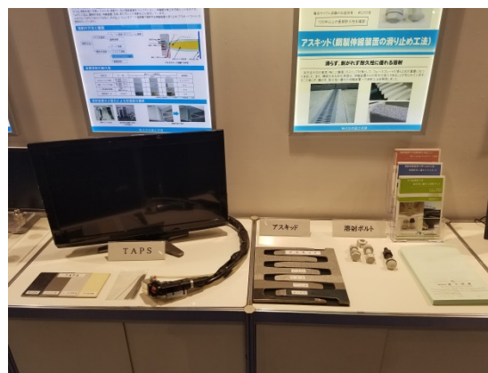
富士技建 展示状況